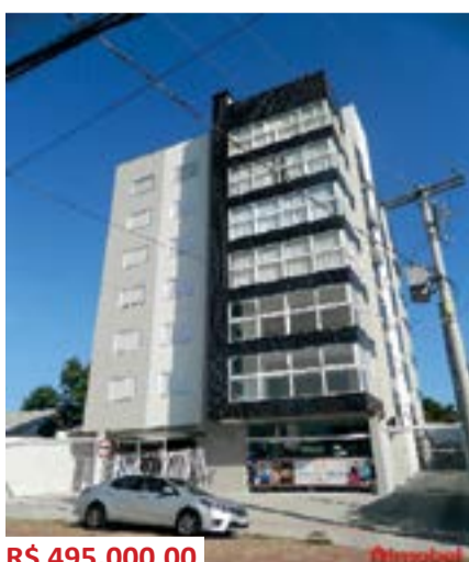
Ed. Onix - Goias (10010961)

Apto., 02 dorm., sendo 01 suíte e possibilidade de 02 box por apto. Incorporação: R7-70.319.