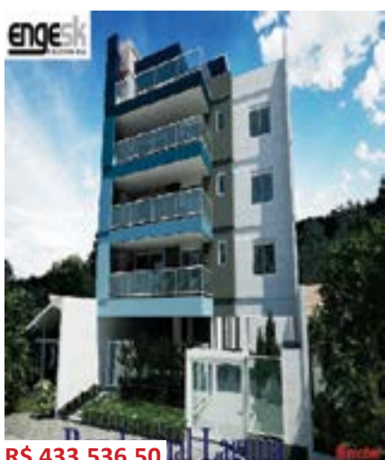
Ed. Laguna - Santo Inacio (10010940)

Apto., 02 suítes, sala de estar, sala de jantar, cozinha, área de serviço, sacada, salão de festas. Incorporação: R-12-674. Ref. Apto. 301.