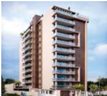
Ed. Neo - Centro (10010923)

Apto., 02 dorm., sendo 01 suíte, ampla sacada, espaço gourmet, acabamento de alto padrão com localização privilegiada. Incorporação: R-2-104.581.