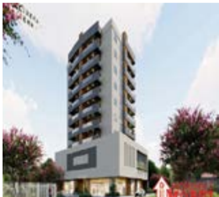
Ed. Ilha de Murano - Centro (10011284)