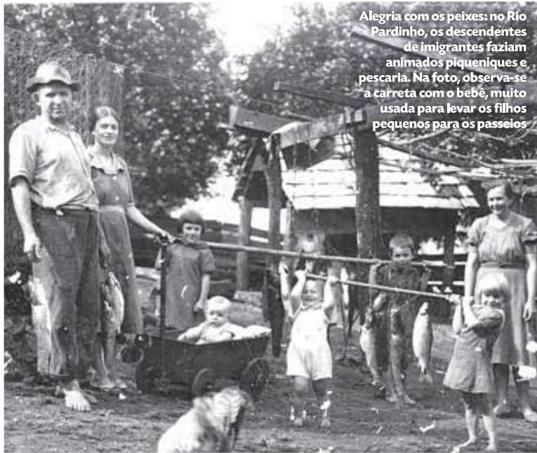
Alegria com os peixes: no Rio Pardinho, os descendentes de imigrantes faziam animados piqueniques e pescaria. Na foto, observa-se a carreta com o bebê, muito usada para levar os filhos pequenos para os passeios