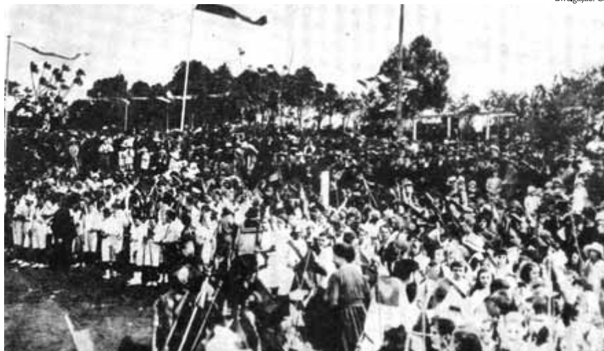
Descendentes de alemães festejam em 1922 o centenário da independência do Brasil, para a qual muitos germânicos colaboraram

O gesto de Dom Pedro, de declarar a independência, deve muito à ação e aos ensejos feitos por sua esposa, a princesa Leopoldina, que logo adiante se tornaria a primeira imperatriz brasileira. Como filha de Francisco I, da Áustria, chegara ao Rio de Janeiro para a Corte portuguesa de Dom João VI, em 1817, para o casamento com Dom Pedro, unindo as casas dos Habsburgo e dos Bragança. Mal Dom João VI havia retornado a Lisboa, e o cenário conflituoso tanto no Brasil quanto em Portugal, que queria fazer o primeiro voltar à condição de mera colônia, exigia um rápido posicionamento da população e também de Dom Pedro.