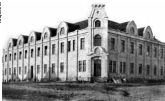
Novo prédio construído pela Companhia de Fumos de Santa Cruz, no início do século 20

Gazeta do Sul vai produzir a partir de agosto ampla série com conteúdos para resgatar os fatos e os personagens mais importantes associados à colonização alemã no Brasil