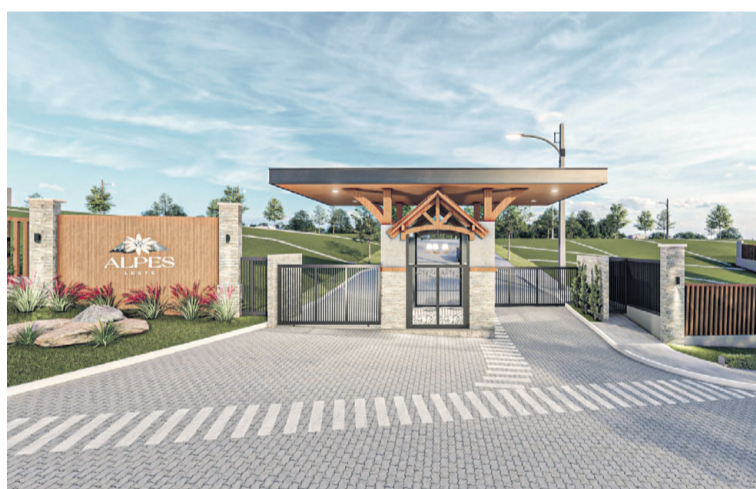
Portaria remota com monitoramento 24 horas

O condomínio está situado em um local alto, que dá o nome a ele: Alpes Leste. São 62 lotes com média de 720m 2 . Um local exclusivo, a cinco minutos do centro de Santa Cruz do Sul