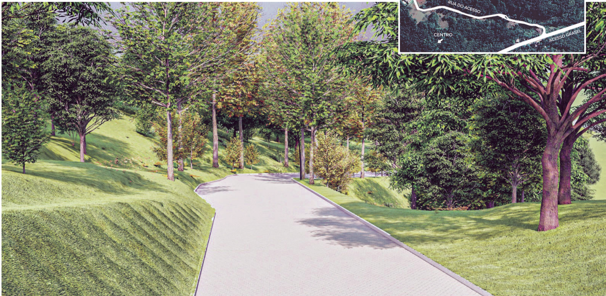
Um caminho romântico entre o Acesso Grasel e o condomínio, chamado de Rua do Acesso

O condomínio está situado em um local alto, que dá o nome a ele: Alpes Leste. São 62 lotes com média de 720m 2 . Um local exclusivo, a cinco minutos do centro de Santa Cruz do Sul