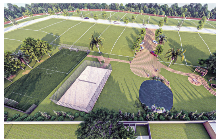
Lotes amplos e área de lazer