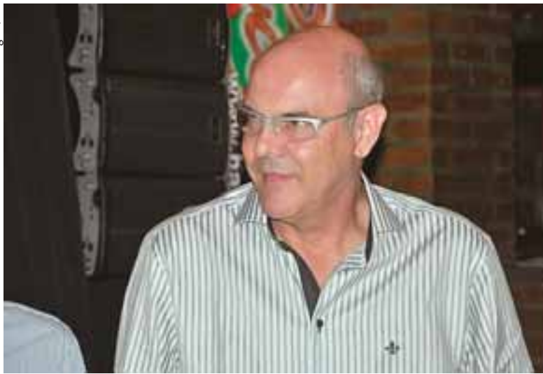
Santa-cruzensense estava com 74 anos e teve atuação reconhecida na saúde e esporte