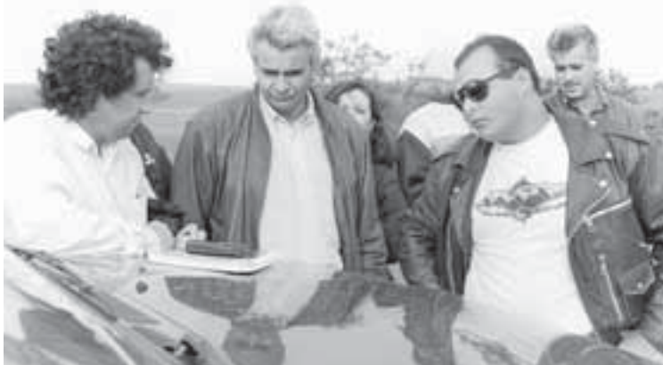
Após o caso, em 1994, policiais e vítimas participaram de reconstituição dos fatos