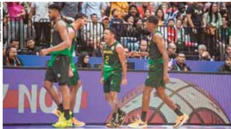
Brasil disputa a competição na Letônia, em busca de vaga nos Jogos Olímpicos de Paris

A organização pede que os participantes doem ao menos dois quilos de alimento não perecível. Contato para informações é 99944 8955.