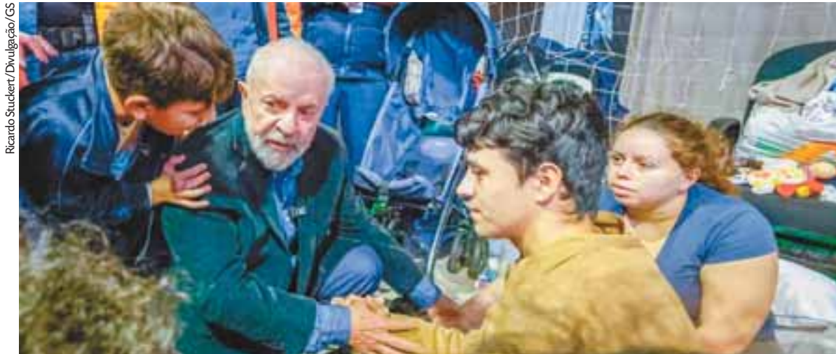
Em sua terceira visita ao Estado, em meio ao cenário de desastre natural, presidente Lula esteve com desabrigados e garantiu casas

“Quando a água baixar, alguns voltarão para casa; mas outros perguntarão: que casa?”, comentou Lula ao reforçar que todas as famílias terão suas residências, por meio do programa Minha Casa, Minha Vida. O mecanismo será possibilitado por diferentes formas, como a compra assistida, em que é apresentado imóvel para aquisição; as chamadas públicas; o estoque de casas para leilão; a aquisição de imóveis