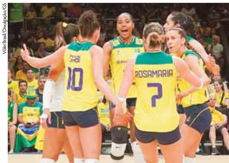
Equipe nacional fez 3 sets a 1 sobre as canadenses e volta à quadra hoje, contra a Coreia