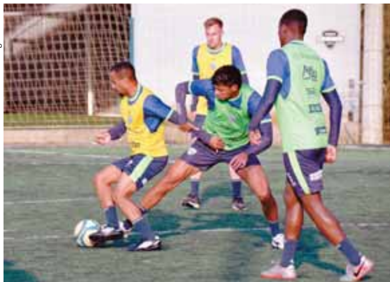
Elenco alviverde trabalhou em uma quadra sintética na tarde de ontem, em Santa Cruz

Até o momento, o Avenida enfrentou o Cascavel em casa e perdeu por 2 a 1. Faltam 13 rodadas para o término da fase de grupos. “Estamos com dificuldades para treinar. Daqui a pouco, vamos enfrentar viagens longas e uma maratona de jogos. O elenco tem feito atividades fun-