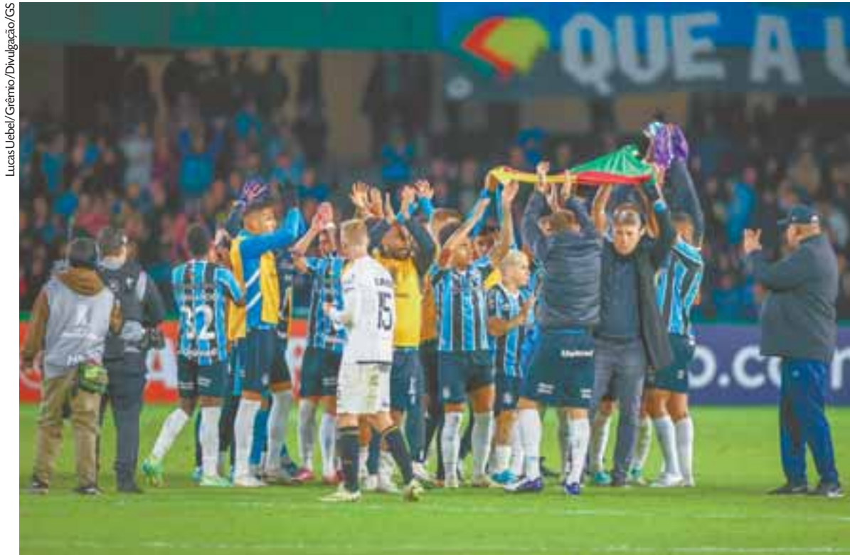
Grêmio retornou aos gramados na quarta-feira e aplicou uma goleada por 4 a 0 no líder do grupo, o The Strongest, em Curitiba

GAZ Leia colunas de Guedes também em gaz.com.br