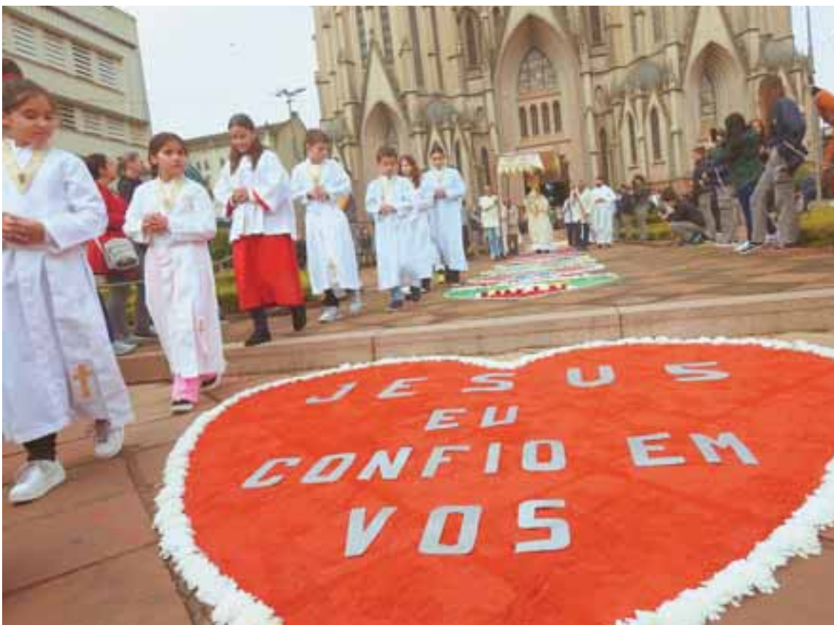
Tapetes coloridos são uma das principais marcas da celebração religiosa. Fiéis realizaram procissão pelas ruas centrais de Santa Cruz