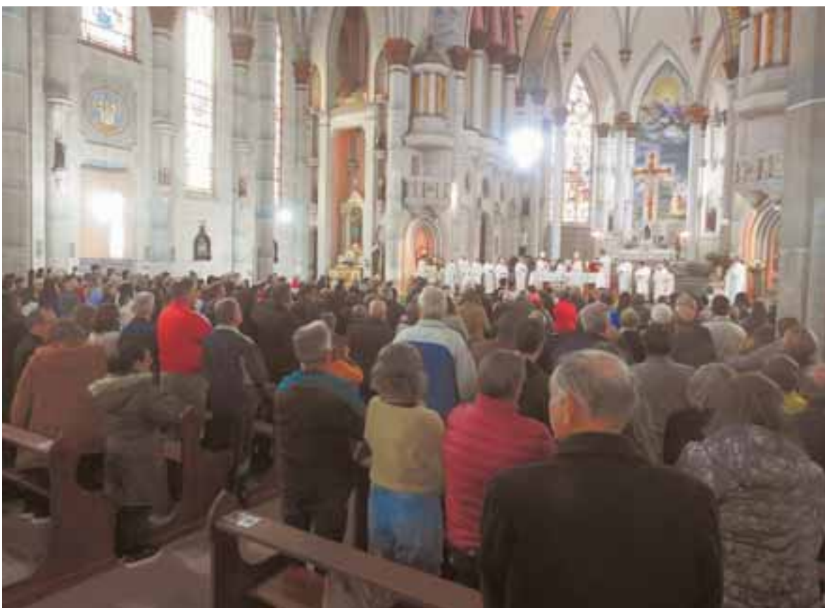
Catedral São João Batista ficou lotada para missa. Fiéis levaram doações de alimentos para dar auxílio aos atingidos pela enchente