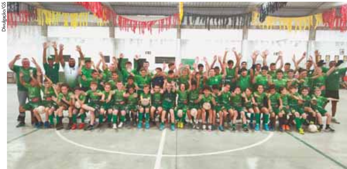
Iniciativa do clube contempla cerca de cem crianças e jovens entre 5 e 17 anos, que disputam a Copa Kids e o torneio Sub-18 da Lifasc

Esperança de medalha do Brasil na Olimpíada, Piu segue na sua reta final de preparação, após um ano marcado pela lesão no joelho em fevereiro de 2023, e a cirurgia à qual foi submetido. Foram cinco meses afastado de competições até o retorno às pistas no segundo semestre. Neste ano, estreou com vitória nos 400m rasos do torneio "Florida Relays" com o tempo de 45s25.