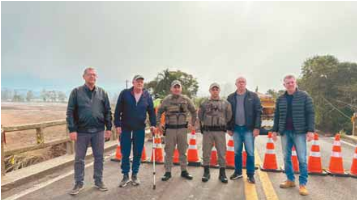
Candelarienses reforçam a preocupação com a estrutura danificada, que serve de acesso à referência em saúde, Santa Cruz do Sul

Para amenizar, o Exército havia instalado uma passarela, que foi danificada pela nova cheia do rio. A que tem sido utilizada é uma estrutura no modelo pênsil, mas que tem certa restrição, pois representa perigo e dificuldade de passagem de materiais. “Na passarela do Exército atravessavam 1,5 mil pessoas por dia”, conta o secretário, para destacar a relevância da estrutura.