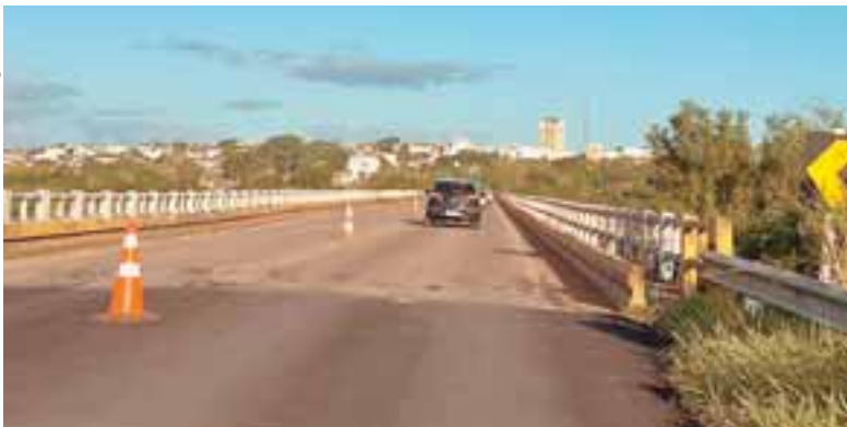
Obras no local começaram ontem. Enquanto isso, será adotado o sistema pare e siga