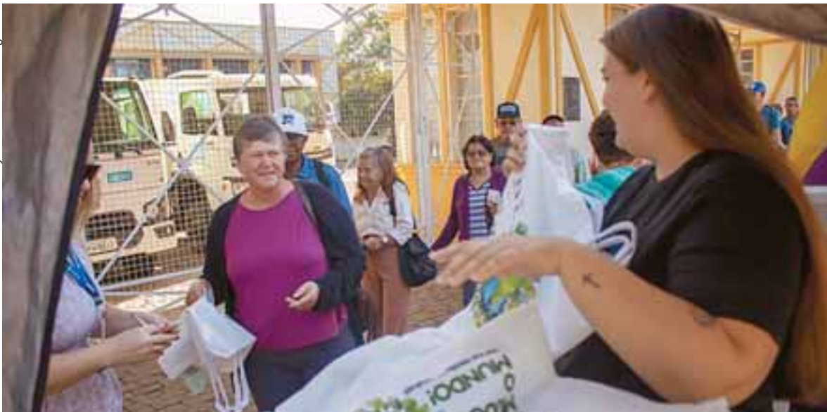
A cada edição da iniciativa são oferecidas 400 unidades das sacolas. Para retirar, é preciso apresentar os cupons publicados no jornal