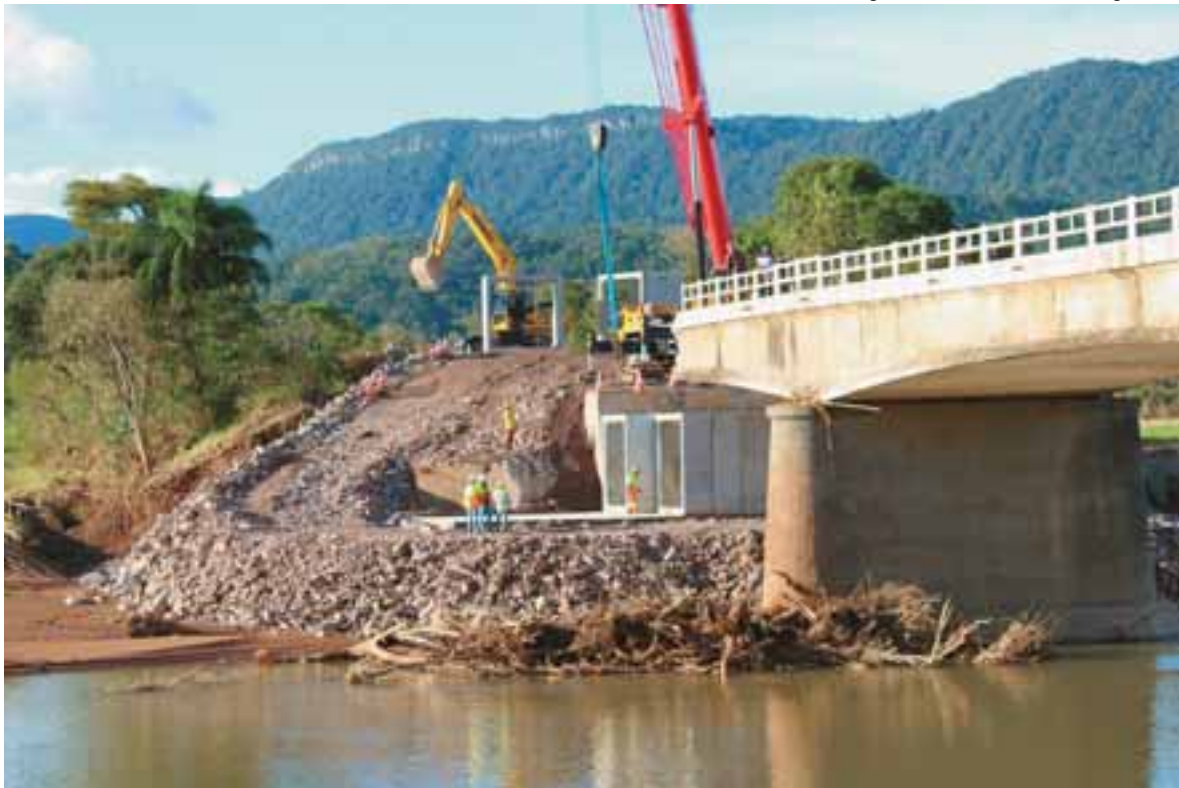
Equipe da Rota de Santa Maria instalou galerias para dar vazão à água do rio, quando forem registradas novas cheias no local

A empresa tem focado a recuperação de pontos como esse, tendo liberado o trânsito em nove e com reparos em quatro. A