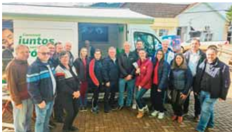
Entrega do primeiro lote de mesas de escritório com gaveteiro ocorreu na quarta-feira