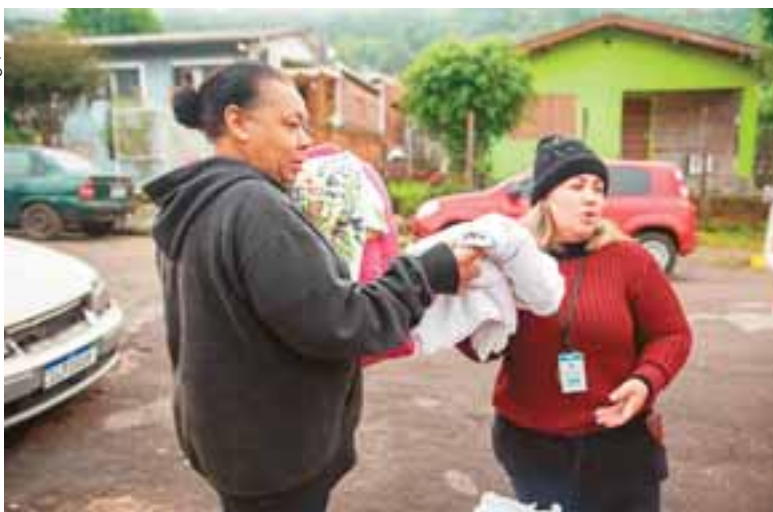
Estão previstos 32 varais nos bairros da cidade e também no interior até o início de julho