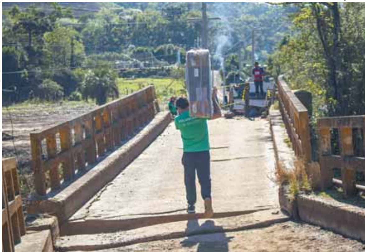
Voluntários enfrentaram a dificuldade do local para entregar à comunidade as doações vindas de todo o Brasil e do exterior