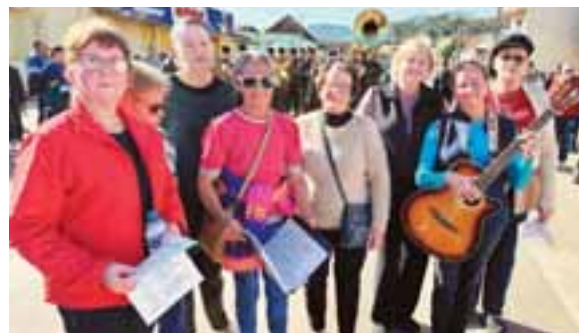
Elas Violão EnCanto