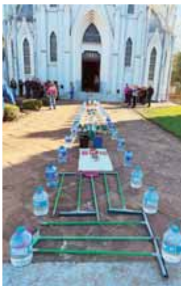
O tapete humanitário