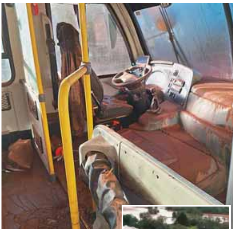
Ônibus ficaram submersos (no detalhe) e não estão mais em condições de uso