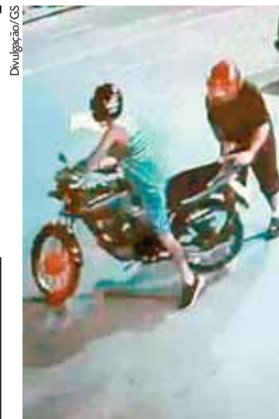
Câmera mostra ação dos dois criminosos