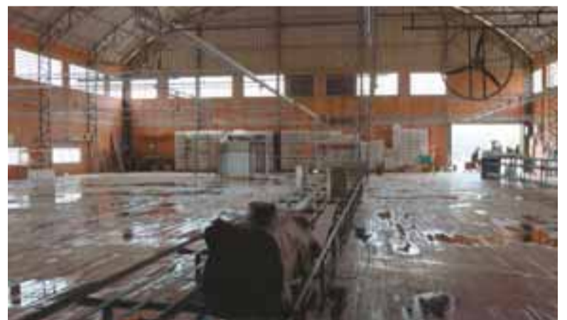
Força-tarefa providenciou a limpeza das instalações e a retirada dos equipamentos

Dentro da empresa o nível da água chegou a 1,20 metro, o que danificou a matéria-prima e o estoque. Os 37 trabalhadores, porém, foram tranquilizados quanto à continuidade das operações. Estão em férias, enquanto o funcionamento é restabelecido.