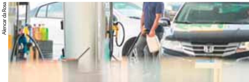
Ao longo dos últimos dias, população tem lotado os postos de combustíveis da cidade

Alguns locais chegaram a suspender o atendimento, por falta de gasolina. Na noite de terça, um caminhão-tanque carregado com o produto foi avistado por