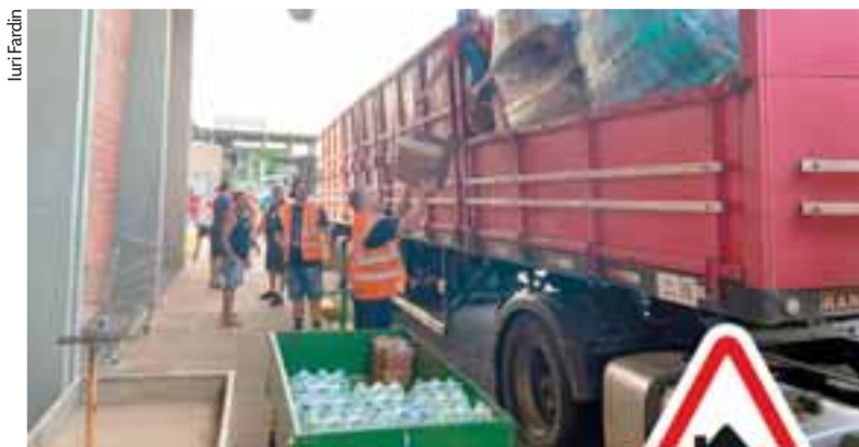
Trabalho intenso para receber e montar as cestas básicas