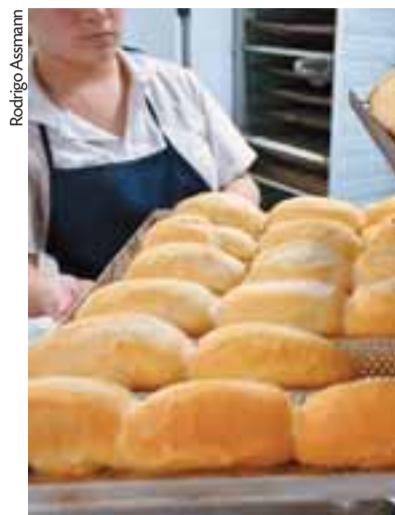
Pão francês é um dos itens com aumento

As alterações são consequência de uma medida do governo do Estado para ampliar a arrecadação de impostos. Ela deveria ter entrado em vigor no início de abril, mas foi adiada após a proposta de elevar a alíquota básica do ICMS de 17% para 19%. Porém, sem apoio na Assembleia Legislativa para a aprovação, o projeto foi retirado. A decisão foi publicada em edição extra do Diário Oficial no dia 30 de abril.