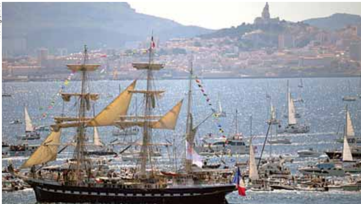
Peça foi trazida em navio de três mastros que veio da Grécia, e o revezamento começa hoje, passando por lugares icônicos da França

o Comitê Organizador, disse que o retorno da competição à França foi motivo para uma celebração fantástica. “Como ex-atleta, sei o quanto é importante o início de um evento. Por isso escolhemos Marselha, porque é definitivamente uma das cidades mais