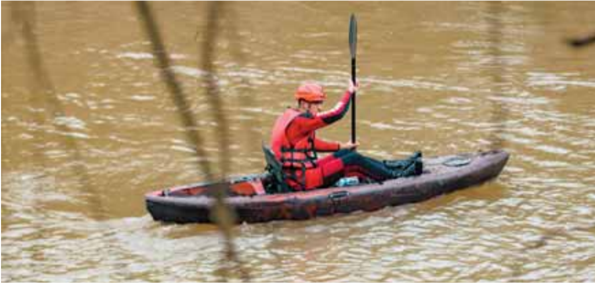
Na água e nas margens do rio, integrantes do Corpo de Bombeiros de Santa Cruz do Sul procuram dois homens desaparecidos