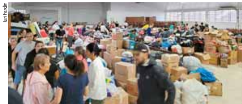
Voluntários realizaram a triagem das doações e enviaram para os lugares atingidos

Rua Borges de Medeiros, 929 | Munchen Open Mall - Loja 47