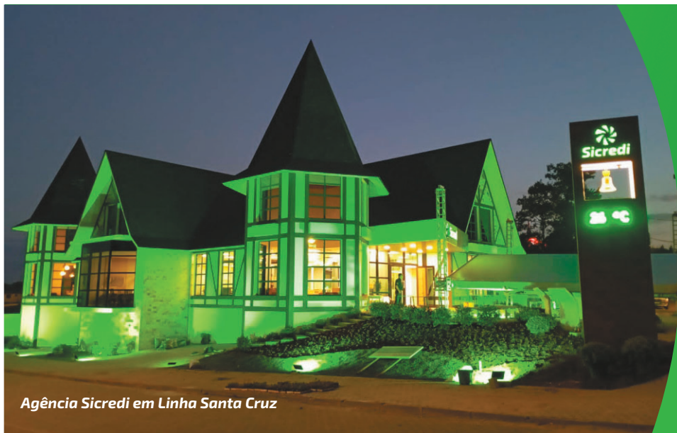
Agência Sicredi em Linha Santa Cruz