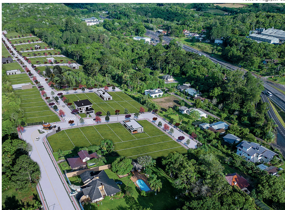
Exclusividade: a vista aérea do La Sierra, o primeiro loteamento de acesso controlado