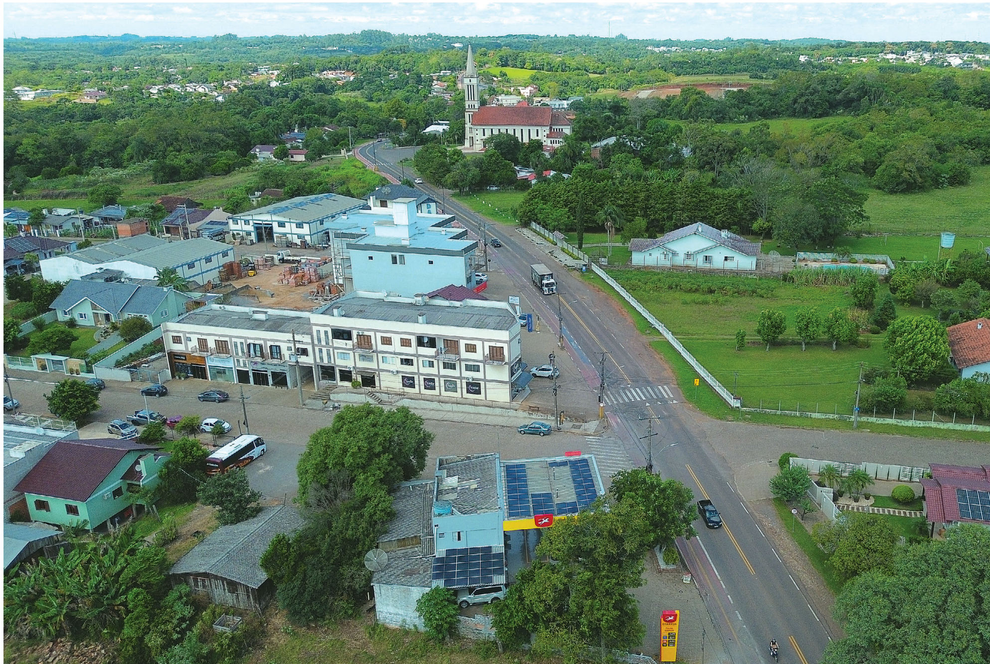
Registro de Linha Santa Cruz nos dias de hoje: desenvolvimento é reflexo do trabalho incansável e da persistência de seus colonizadores ao longo dos anos

E m 1849, alemães deixam a sua terra tendo como destino uma área que prometia trabalho e desenvolvimento. Cerca de quatro meses depois, em veleiros, eles chegam ao Rio de Janeiro, de onde são direcionados para a Província de São Pedro do Rio Grande do Sul. A eles são destinadas áreas localizadas às margens da Estrada de Cima da Serra, aberta para ligar duas regiões de criação de gado: a Campanha Gaúcha e os Campos do Planalto, interligando Rio Pardo e Cruz Alta.