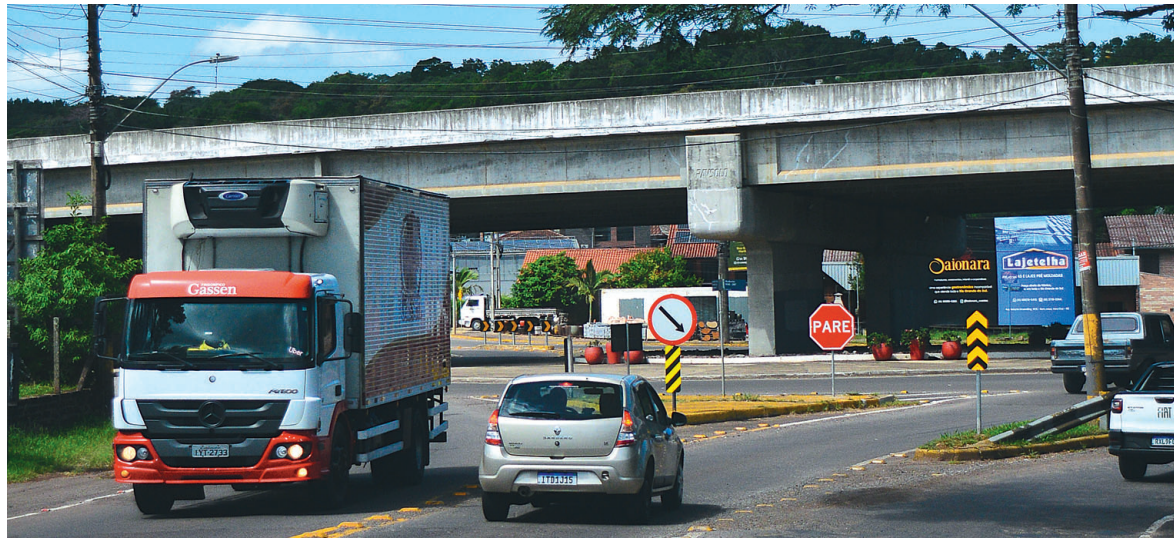
Aumento do fluxo de veículos já acende alerta para a necessidade de investir em mobilidade urbana