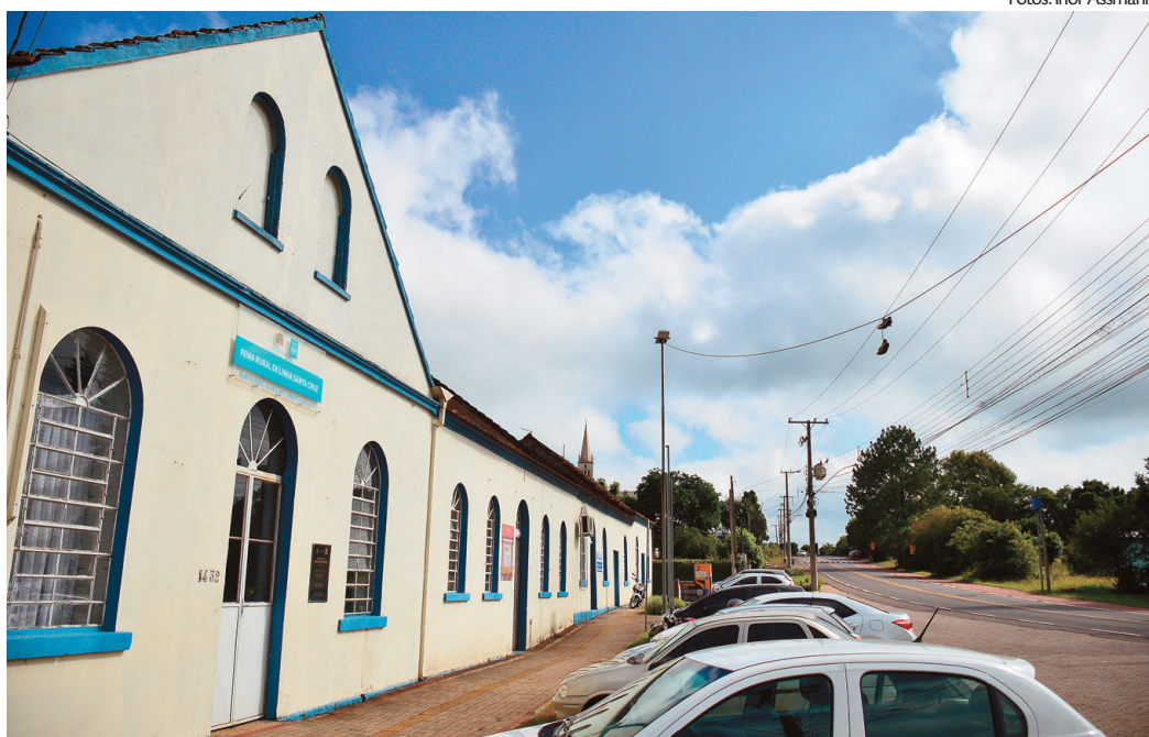
Sede da antiga cooperativa hoje abriga a Subprefeitura, a Feira Rural, a Amorlisc e o Rotary Club Cidade Alta

Era um projeto antigo, de uns quatro ou cinco anos, e que agora está sendo colocado em prática", disse, esclarecendo que a previsão de concluir a obra é ainda no primeiro semestre. E, em breve, deve ser criado um Memorial, com acervo histórico de livros, documentos e fotos dos imigrantes. O objetivo é instalar no prédio da antiga cooperativa, onde hoje funciona a subprefeitura, a feira rural e o Rotary Club Santa Cruz Cidade Alta.