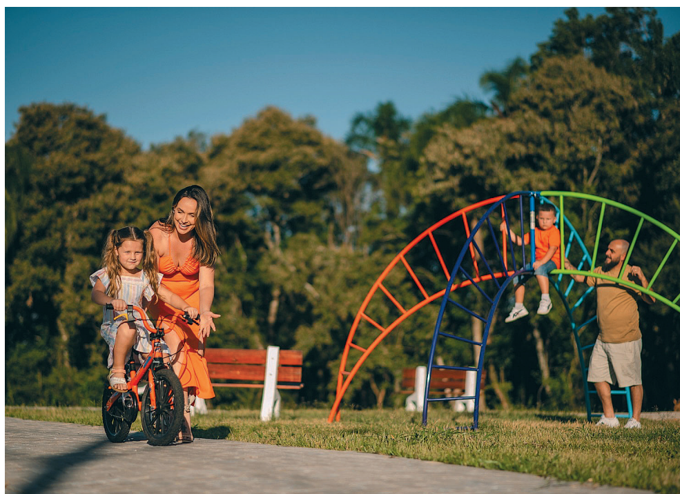
Praça do Parque Jardine, empreendimento que integra áreas verdes e opções de lazer