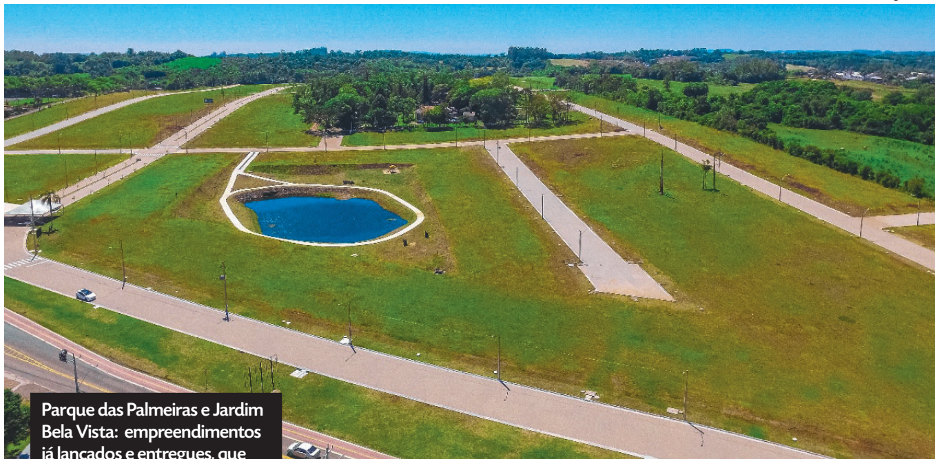
Parque das Palmeiras e Jardim Bela Vista: empreendimentos já lançados e entregues, que se destacam pelo urbanismo planejado, áreas de lazer e infraestrutura completa.

E ele ainda acrescenta que o crescimento da Linha Santa Cruz tem sido muito bem planejado e estruturado, e que a Casa Nova tem orgulho de fazer parte dessa transformação. "Nos últimos anos, a região passou de uma área promissora para um polo consolidado de desenvolvimento urbano, atraindo novos moradores e investidores. O envolvimento de diversos empreendedores, junto ao poder público e à comunidade, tem garantido que esse crescimento ocorra de forma sustentável, mantendo a essência do bairro e ampliando sua infraestrutura", diz.