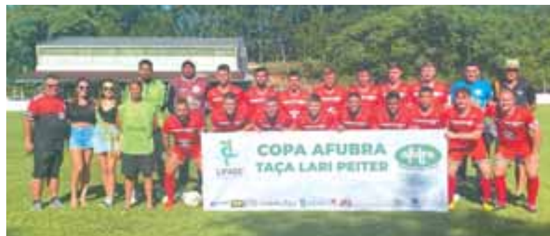
Equipe finalista 2024, categoria titulares. Final ocorrerá neste domingo, em Pinheiral