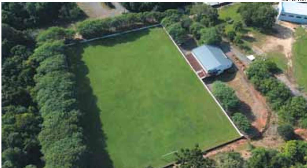
Estádio Guilherme Rabuske, inaugurado em 2001