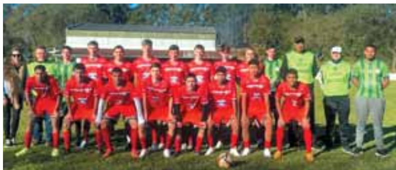
Equipe Sub 18, campeã em 2024