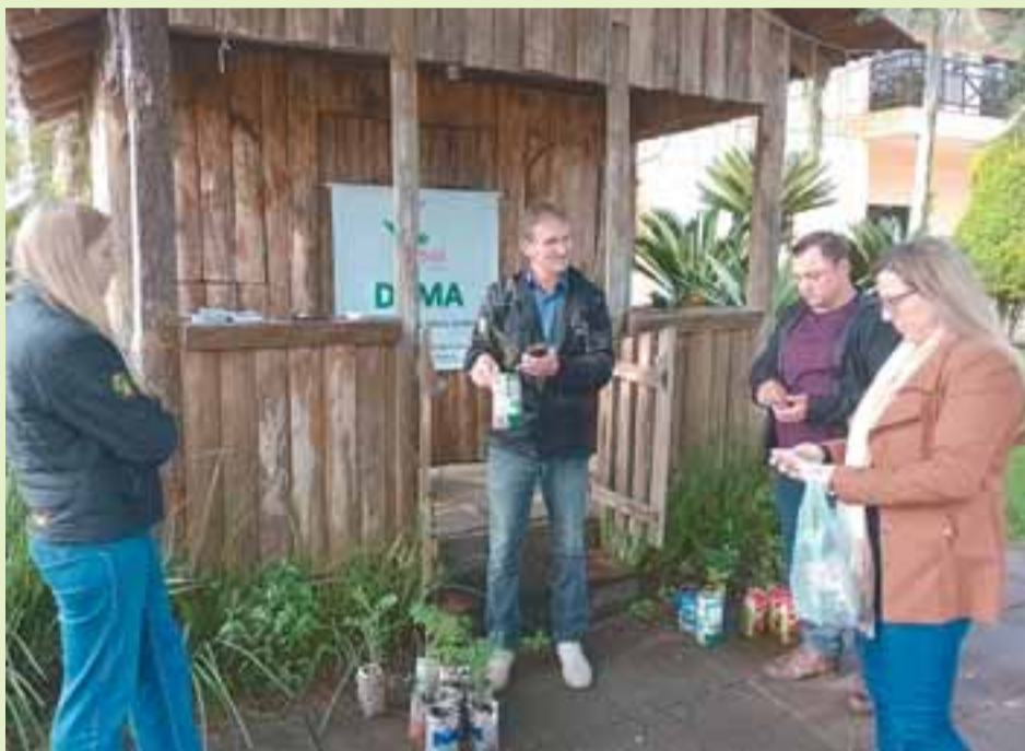
Entre as atividades, troca de eletrônicos para descarte por mudas, chamou a atenção

A semana se encerra neste sábado com um almoço experimental com PANCs e uma caminhada junto à natureza, no Recanto da Figueira. A participação do município em debates estaduais reafirmou o compromisso com políticas ambientais responsáveis e o fortalecimento das ações locais de preservação.