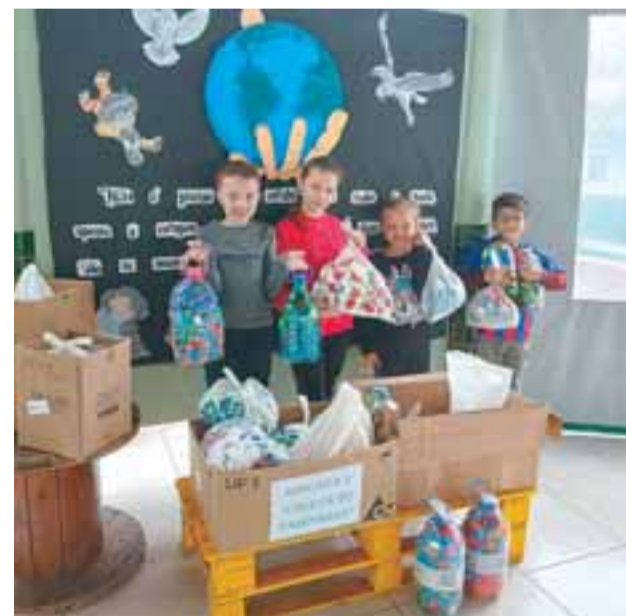
Coleta de recicláveis mobilizou os alunos do município durante a última semana

A comunidade deve participar ativamente do recolhimento de diversos resíduos, como lâmpadas, eletrônicos, óleo de cozinha, tampinhas plásticas e medicamentos vencidos, em ações durante o ano todo. Encerrando a programação, no próximo dia 17, estudantes da Escola Municipal de Ensino Fundamental Santo Antônio de Pádua participarão da Conferência Nacional Infantojuvenil pelo Meio Ambiente.