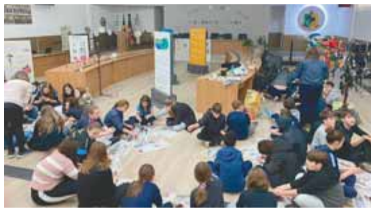
Oficinas realizadas durante a semana promoveram engajamento para ações práticas

O encerramento, neste sábado, ocorrerá com a realização de uma Ecofeira na Travessa São Sebastião Mártir. No espaço, durante o turno da manhã, haverá coleta de resíduos, feira de adoção de animais e distribuição de mudas nativas. A mobilização reafirma o compromisso do município com atitudes concretas e o envolvimento de todos na construção de um presente responsável, para garantir um futuro melhor a todos.