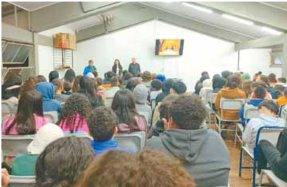
Junto aos alunos do município, Rio Pardo reforça a importância da sustentabilidade

O encerramento, que ocorre neste sábado, com a 1ª Feira Municipal de Adoção de Animais e um drive-thru para descarte de eletrônicos e óleo de cozinha usado, marca a finalização do trabalho de mobilização no município. A união entre natureza e história reafirma o compromisso de Rio Pardo com um amanhã mais verde e consciente.