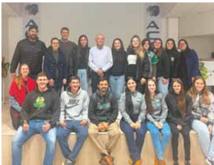
Lange destacou a adoção de práticas sustentáveis para elevar a qualidade de vida

O município de Candelária reforçou seu compromisso com o meio ambiente ao promover uma palestra sobre jardins agroecológicos urbanos na última quarta-feira, na Associação Comercial e Industrial de Candelária. O encontro abordou temas como mudanças climáticas, segurança alimentar e valorização dos espaços públicos, destacando a importância da biodiversidade nas áreas urbanas.