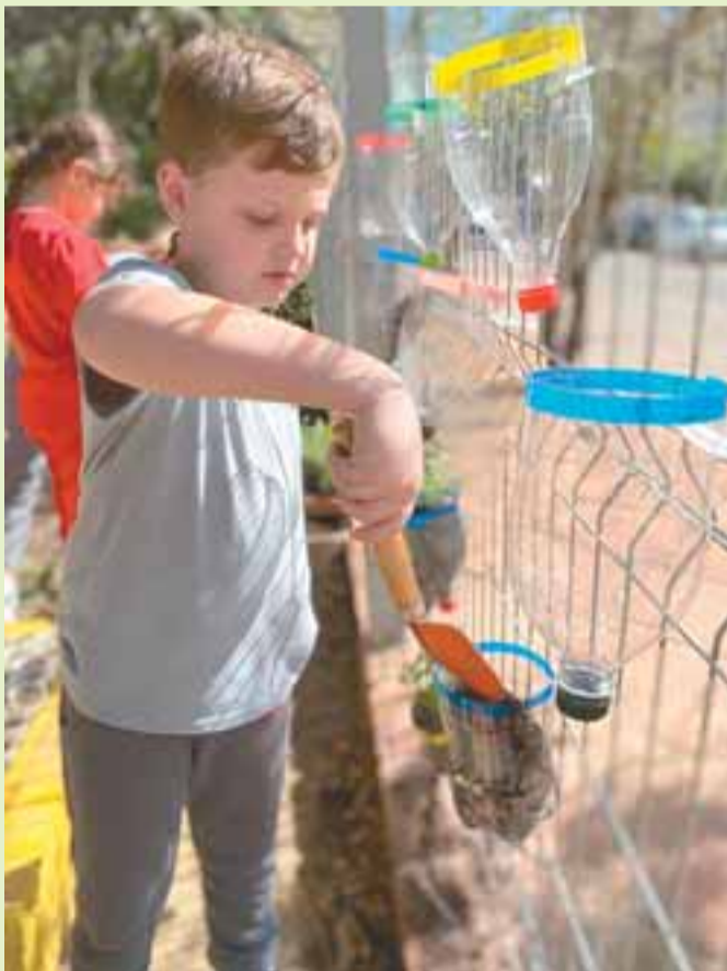
Intimidade com o meio ambiente, promovida por meio do plantio nas escolas, em Santa Cruz

A campanha uniu diferentes setores em torno da ideia de que sustentabilidade se constrói com escolhas conscientes e ações contínuas. Empresas, escolas, famílias e o poder público somaram esforços para mostrar que pequenas atitudes, quando multiplicadas, geram impactos reais. O plantio, a educação ambiental e o consumo responsável foram tratados como partes de um mesmo ciclo. Com envolvimento coletivo e espírito de cuidado, Santa Cruz reafirma seu compromisso com um futuro mais equilibrado, duradouro e possível para todos.