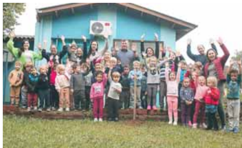
Na Emel Pingo de Gente, a animação dos pequenos contagiou a atividade