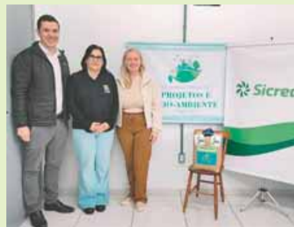
Instalação do Eco Ponto para destinação de pilhas, junto à Prefeitura

As ações de Herveiras reforçaram o papel da educação na formação de uma sociedade mais consciente e comprometida com o meio ambiente. Ao estimular o descarte correto e o cultivo de árvores, o município dá exemplo de como pequenas atitudes geram grandes transformações, independente do tamanho ou concentração de população em um município.