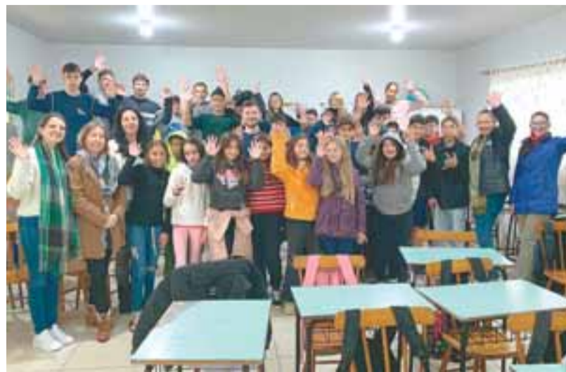
Palestra sobre a redução de plásticos na Escola Municipal José de Anchieta