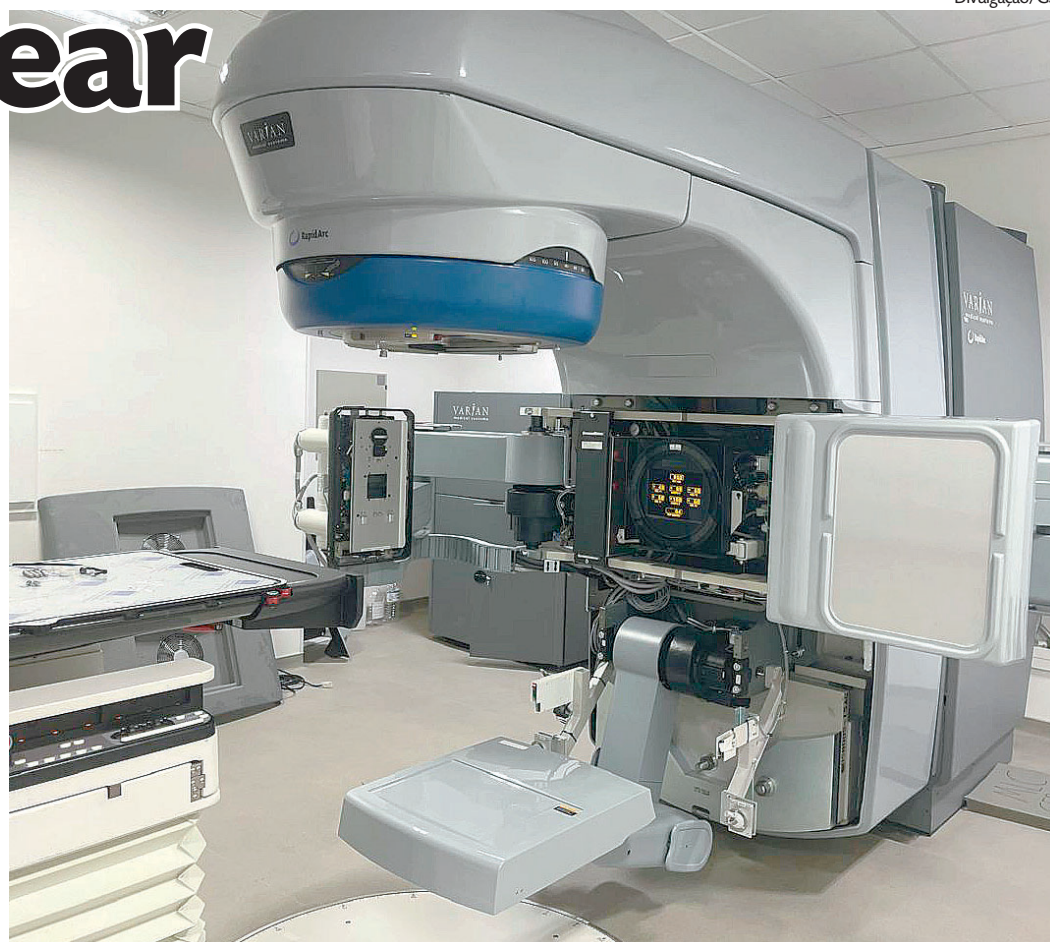
Equipamento vai passar por upgrade para realizar procedimentos de alta complexidade

O Hospital Ana Nery é referência em oncologia para 49 municípios gaúchos. Com o upgrade, além de desafogar a demanda da Capital, a instituição oferecerá um serviço inovador e estratégico no interior.