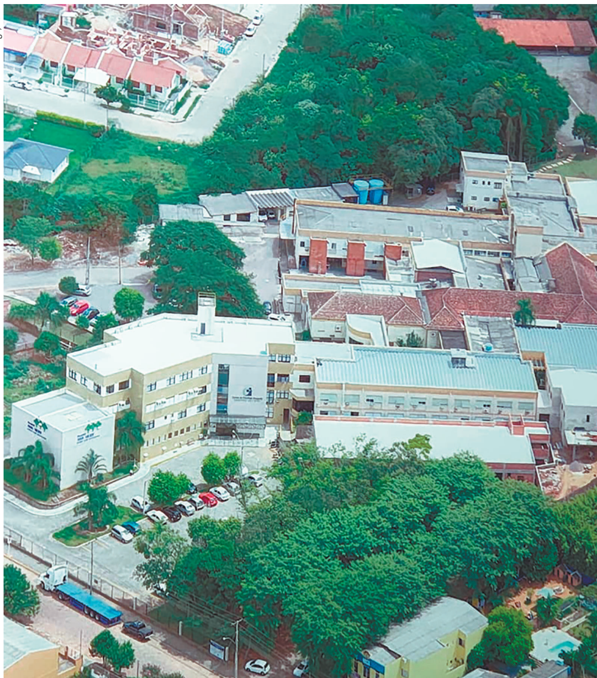
Vista aérea do Ana Nery em 2013. Desde então, o hospital já passou por inúmeras transformações e modernizações