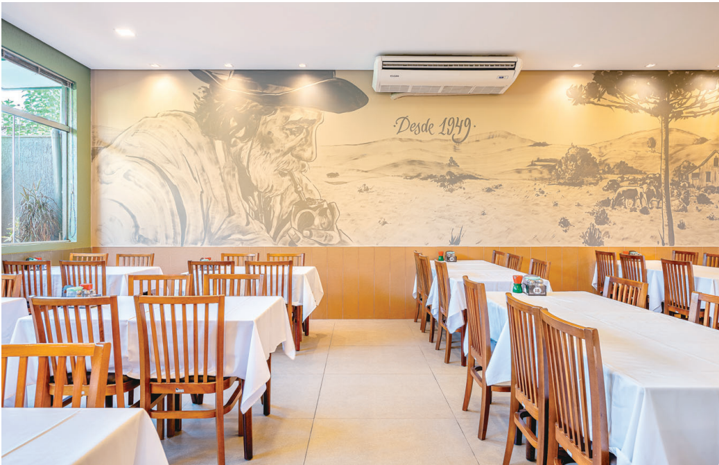
Para simbolizar a data de inauguração da churrascaria e celebrar o orgulho da nossa terra, foi criada uma pintura na parede com a imagem de um gaúcho em um campo. Foi projetada uma brinquedoteca em MDF na cor verde e vidro incolor, permitindo a permeabilidade visual para a área externa, que conta com vegetação natural e iluminação focal.