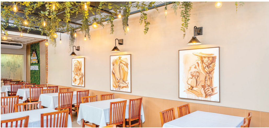
A fim de ornamentar o salão, foi projetado um rebaixo com estrutura de ferro e tela aramada, decorado com plantas e lâmpadas pendentes. Complementando a decoração, quadros com imagens que remetem ao tradicionalismo foram inseridos, reforçando a identidade cultural do espaço.