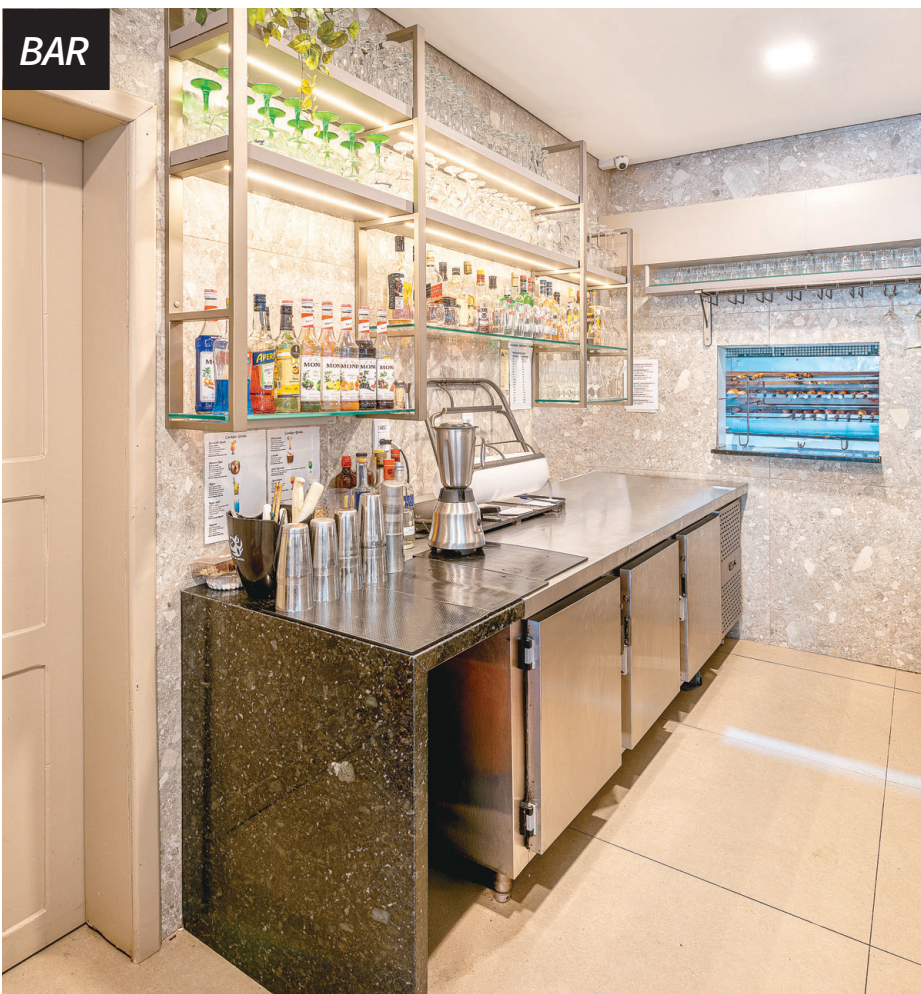
O bar recebeu revestimento no piso e nas paredes. Materiais de alta qualidade e a paleta de cores neutras conferem ao bar um toque sofisticado e contemporâneo. Foi criada uma estrutura de ferro com prateleiras de MDF e vidro incolor para acomodar copos e garrafas, complementada por iluminação estratégica.