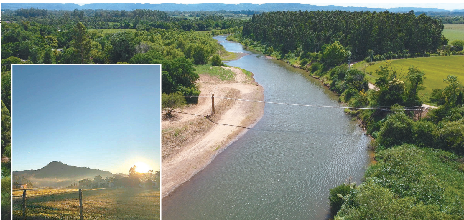
Para apreciar e conhecer: Prainha do Vale, em Faxinal de Dentro, e Morro Trombudo (no detalhe), em Linha 15 de Novembro, estão entre as belezas naturais que encantam os moradores de Vale do Sol e também os turistas