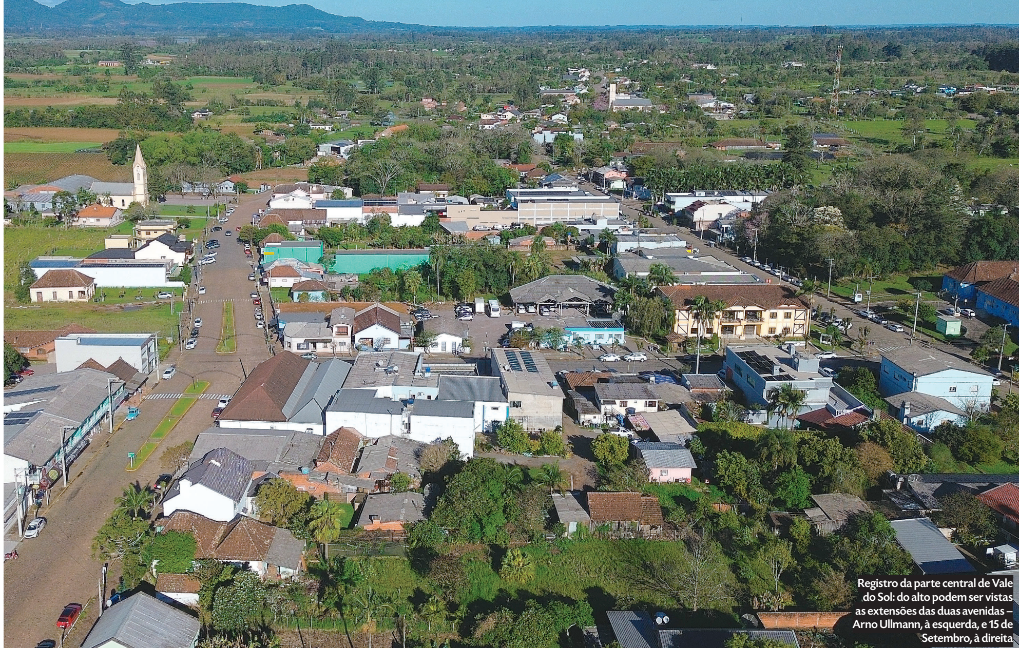
Registro da parte central de Vale do Sol: do alto podem ser vistas as extensões das duas avenidas – Arno Ullmann, à esquerda, e 15 de Setembro, à direita

O início da colonização de Vale do Sol, formado pelos ex-distritos de Trombudo, Formosa, parte de Herveiras, de Santa Cruz do Sul e parte de Candelária, aconteceu com a chegada dos primeiros imigrantes em Rio Pardense no ano de 1862.