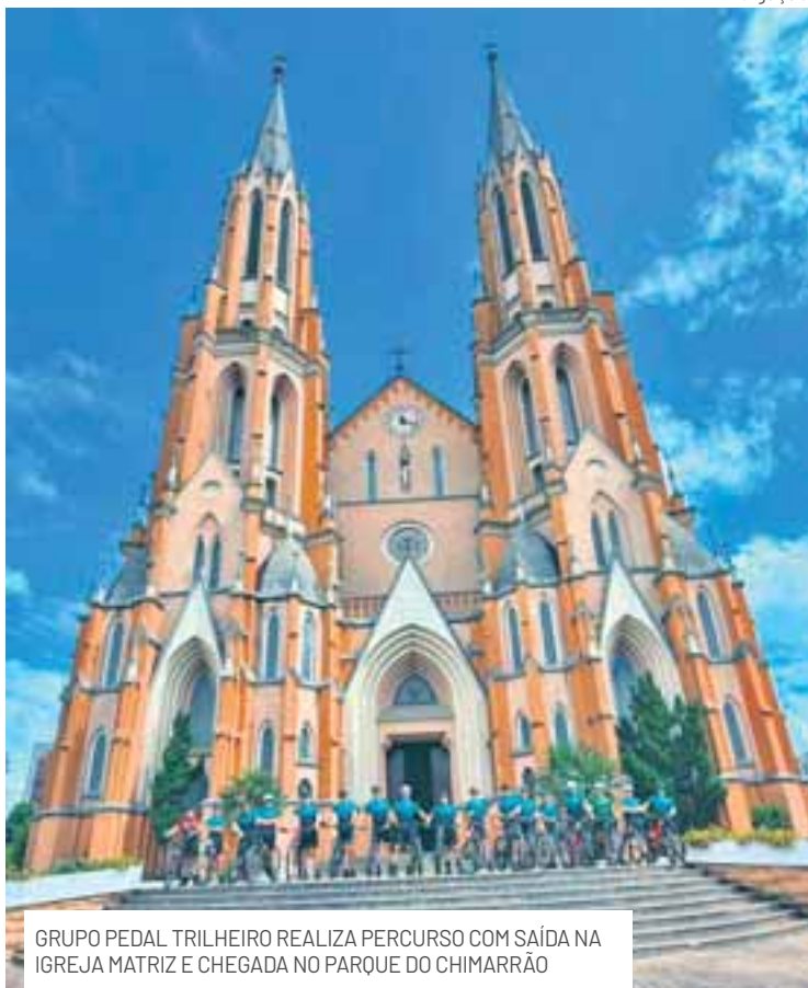
GRUPO PEDAL TRILHEIRO REALIZA PERCURSO COM SAÍDA NA IGREJA MATRIZ E CHEGADA NO PARQUE DO CHIMARRÃO