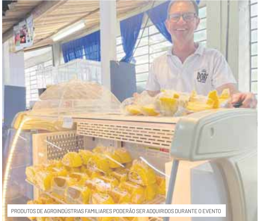
PRODUTOS DE AGROINDÚSTRIAS FAMILIARES PODERÃO SER ADQUIRIDOS DURANTE O EVENTO

Além da programação diversificada, o Festival do Balonismo contará com a presença de expositores de variados segmentos, buscando contemplar todos os gostos e tornar o evento ainda mais especial. A Feira Comercial, localizada no Ginásio de Exposições, na entrada do Parque do Chimarrão, reunirá aproximadamente 40 empreendimentos.