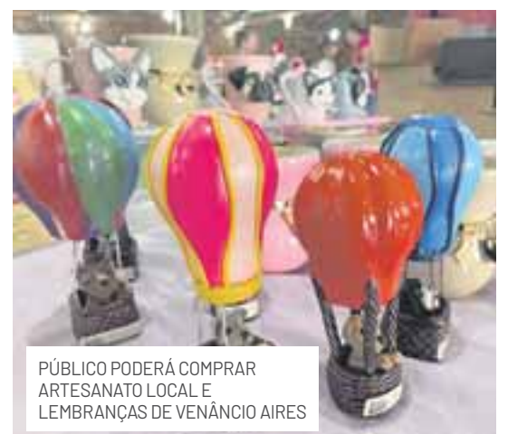
PÚBLICO PODERÁ COMPRAR ARTESANATO LOCAL E LEMBRANÇAS DE VENÂNCIO AIRES