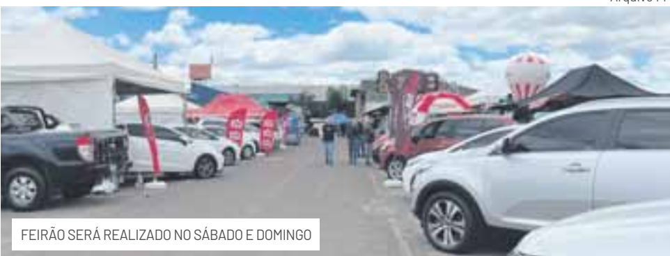
FEIRÃO SERÁ REALIZADO NO SÁBADO E DOMINGO

No sábado e no domingo, dias 22 e 23, a partir das 10h, ocorre mais uma edição do Feirão de Veículos, durante a 6ª edição do Festival de Balonismo de Venâncio Aires, no Parque Municipal do Chimarrão. Neste ano, serão 10 empresas participantes, sendo sete revendas e concessionárias.