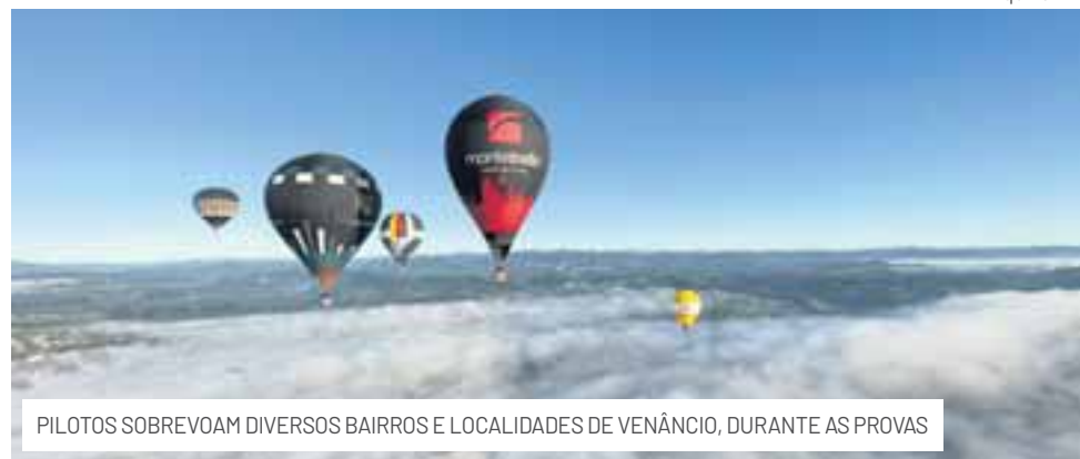
PILOTOS SOBREVOAM DIVERSOS BAIRROS E LOCALIDADES DE VENÂNCIO, DURANTE AS PROVAS