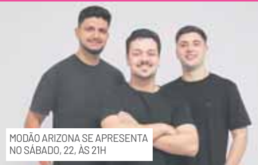
MODÃO ARIZONA SE APRESENTA NO SÁBADO, 22, ÀS 21H