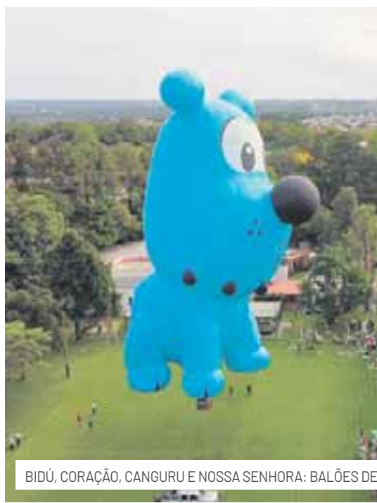
BIDÚ, CORAÇÃO, CANGURU E NOSSA SENHORA: BALÕES DE FORMATO PROMETEM ENCANTAR CRIANÇAS E ADULTOS