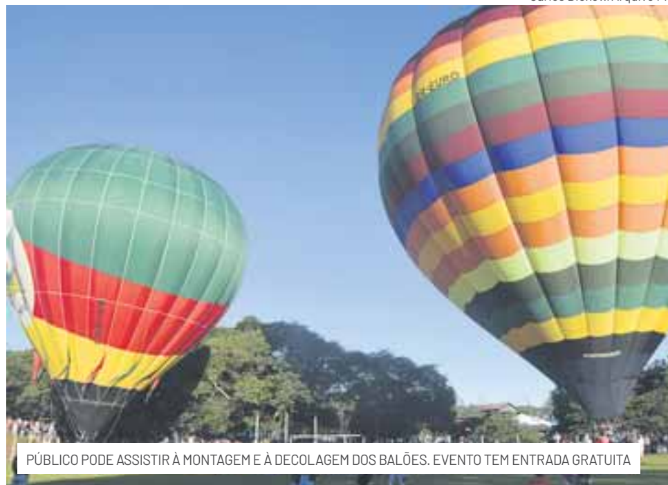
PÚBLICO PODE ASSISTIR À MONTAGEM E À DECOLAGEM DOS BALÕES. EVENTO TEM ENTRADA GRATUITA

Na última edição, no ano passado, 65 mil pessoas passaram pelo Parque do Chimarrão durante o Festival de Balonismo.