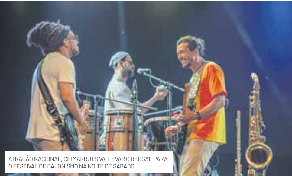
ATRAÇÃO NACIONAL, CHIMARRUTS VAI LEVAR O REGGAE PARA O FESTIVAL DE BALONISMO NA NOITE DE SÁBADO