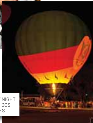
SHOW NIGHT GLOW DOS BALÕES