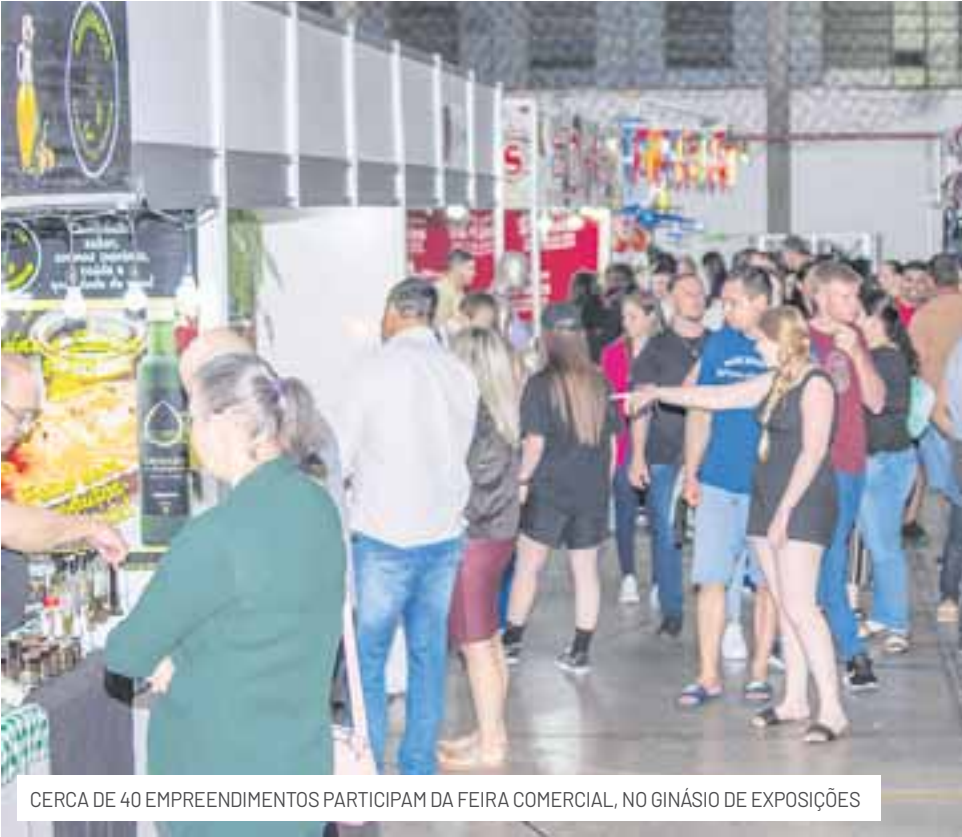
CERCA DE 40 EMPREENDIMENTOS PARTICIPAM DA FEIRA COMERCIAL, NO GINÁSIO DE EXPOSIÇÕES