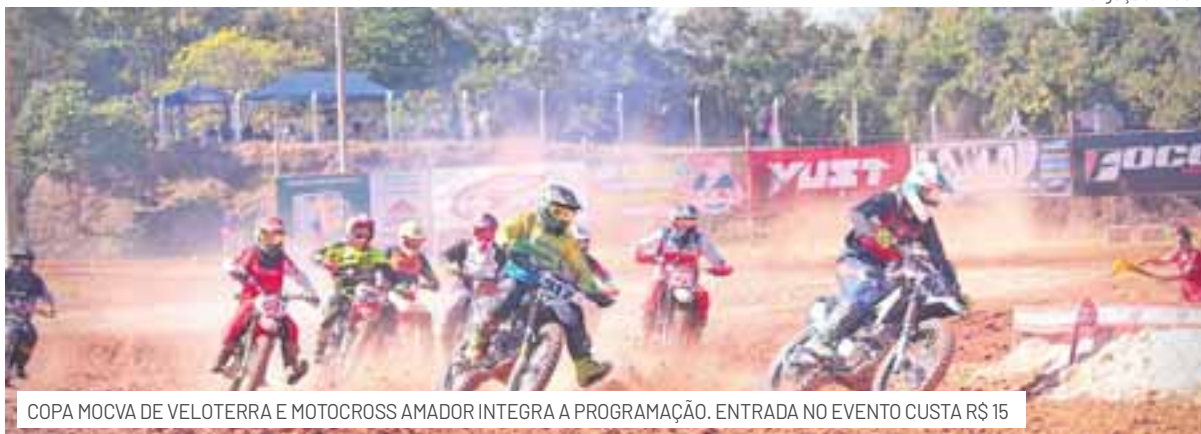
COPA MOCVA DE VELOTERRA E MOTOCROSS AMADOR INTEGRA A PROGRAMAÇÃO. ENTRADA NO EVENTO CUSTA R$ 15

Além da competição de balonismo, carro-chefe do evento, que reunirá 13 pilotos brasileiros em Venâncio Aires, outros esportes também têm espaço na 6ª edição do Festival de Balonismo de Venâncio Aires.