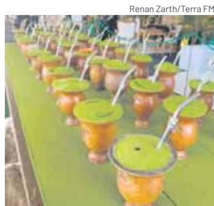
Renan Zarth/Terra FM