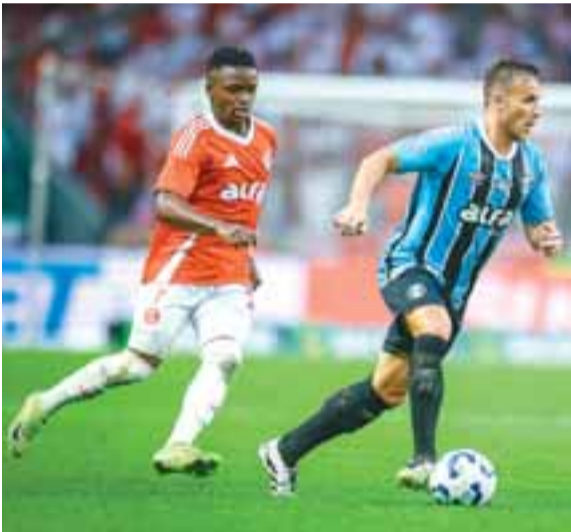
Depois de um ano abaixo da expectativa, dupla Gre-Nal se mantém na elite do Brasileirão