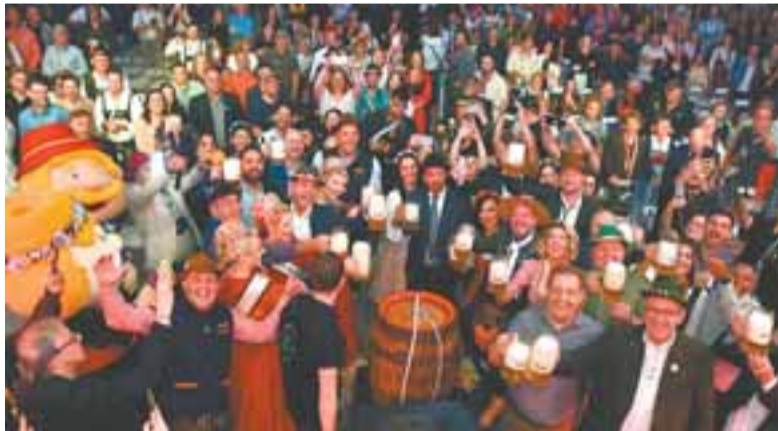
Oktoberfest: abertura em grande estilo ocorreu no Centro de Eventos

● Ao som das bandinhas típicas alemãs, com discursos empolgados, o tradicional brinde e a expectativa de receber meio milhão de visitantes, cerimônia realizada na noite do dia 9 de outubro celebrou o início da 40ª Festa da Alegria.