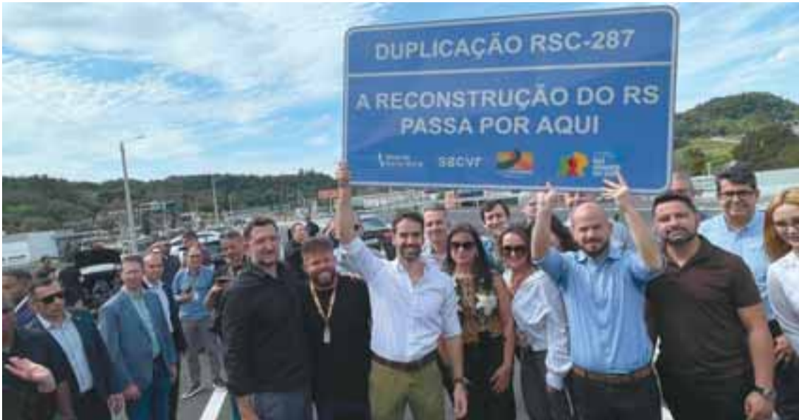
Obra oficialmente entregue pelo Estado: trecho urbano da RSC 287, em Santa Cruz do Sul, conta com pista duplicada