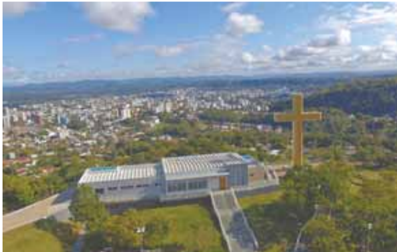
Prefeitura reassume o Parque da Cruz, um dos cartões-postais de Santa Cruz