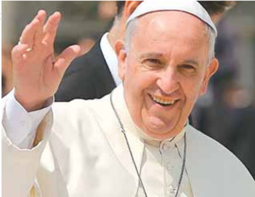
O argentino Jorge Mario Bergoglio, o Papa Francisco: legado de grandes ensinamentos

O mundo dá adeus ao Papa Francisco. Aos 88 anos, ele faleceu vítima de um acidente vascular cerebral (AVC) e de insuficiência cardíaca.