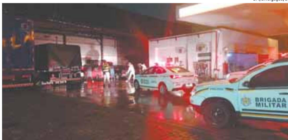
Apreensões de drogas aumentam 767,5% no primeiro semestre nos municípios da região