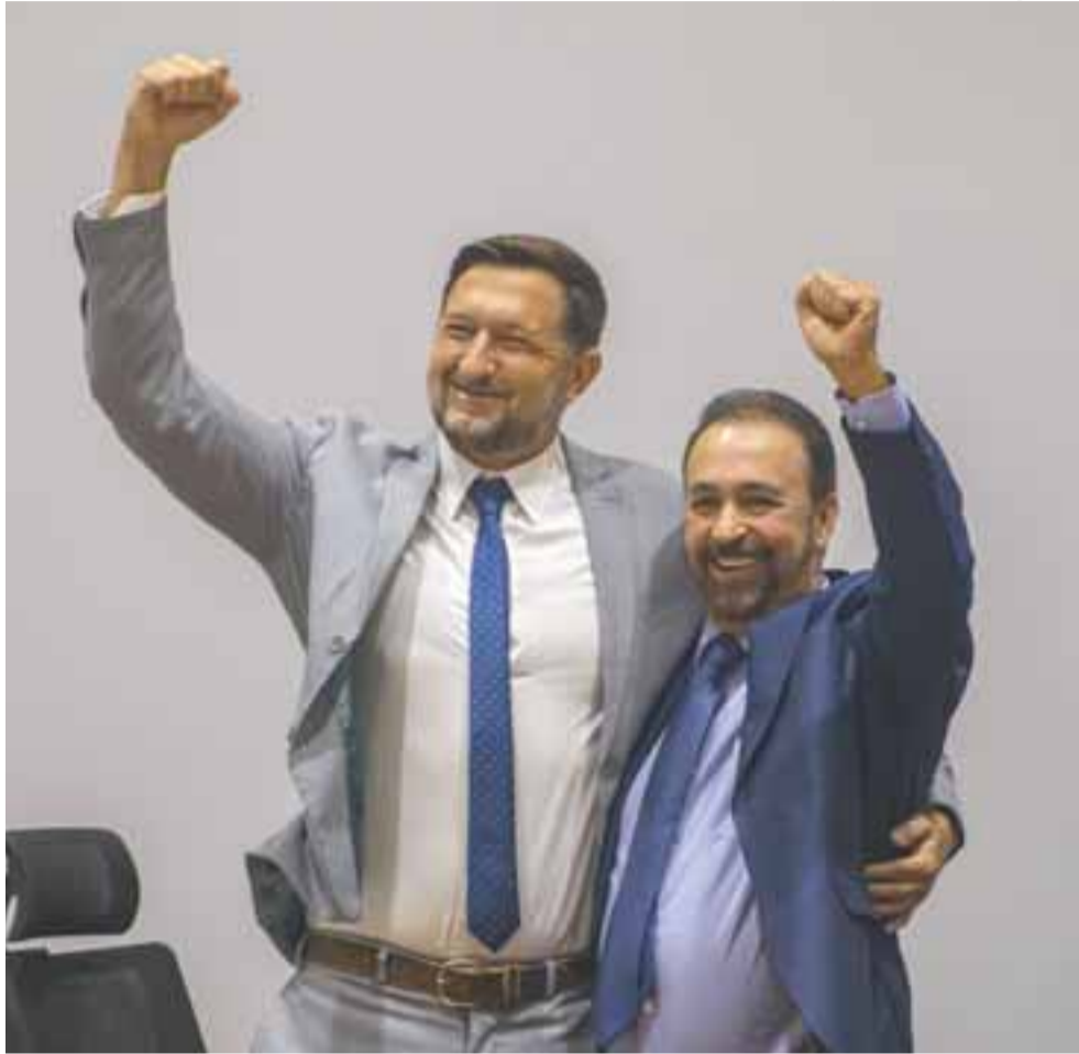
O prefeito Sérgio Moraes e o vice Alex Knak, no ato de posse na Câmara de Vereadores, em Santa Cruz

● Os 80 anos de fundação da Gazeta do Sul – e, por conseguinte, da Gazeta Grupo de Comunicações – completados no dia 26, foram comemorados com café da manhã especial no espaço da Redação Integrada, que reuniu colaboradores, direção, antigos e ex-integrantes do grupo.