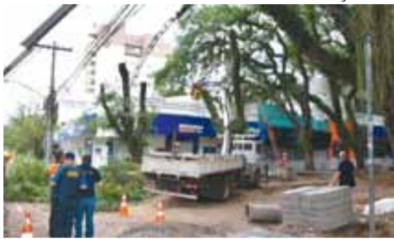
Corte de tipuanas chamou atenção da comunidade

● Duas tipuanas foram condenadas e precisaram ser removidas no trecho onde ocorriam as obras do calçadão da Floriano. Dias depois, outras duas tombaram no ponto da revitalização e o Ministério Público sugeriu a paralisação das obras. A Prefeitura convocou reunião para tratar do assunto. No dia seguinte, o MP abriu investigação para apurar os possíveis danos ambientais causados pelo corte das árvores, pediu a paralisação das obras e não descartou acionar o Judiciário.