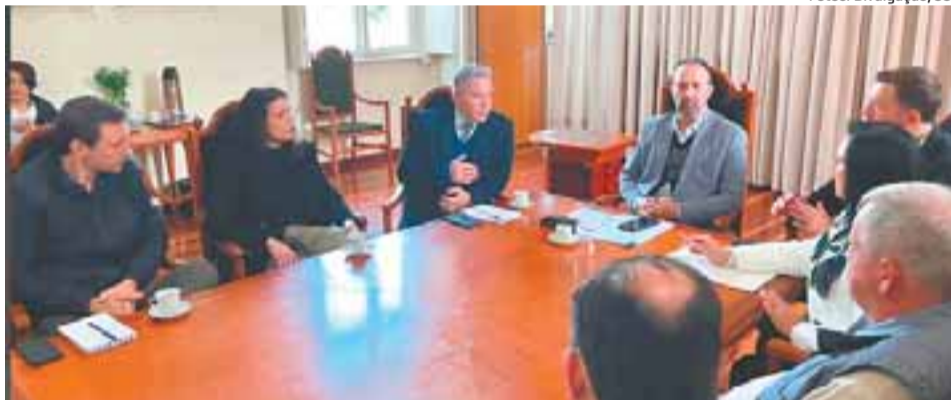
Assunto foi tratado em reunião entre representantes do Ministério Público e do Município