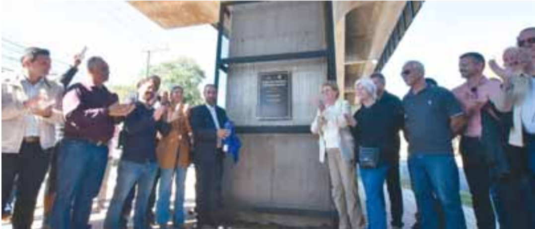
Registro da tão esperada inauguração do viaduto do Arroio Grande, idealizado para otimizar o trânsito

Após quase dois anos de espera, o viaduto Edmundo Hoppe, no Bairro Arroio Grande, foi oficialmente inaugurado em Santa Cruz do Sul. A estrutura de 264,83 metros, com investimento de R$ 12 milhões, está localizada no entroncamento das avenidas Deputado Euclides Nicolau Kliemann e Presidente Castelo Branco. Comportando veículos de até 45 toneladas, dará mais fluidez ao trânsito, especialmente em horários de pico.