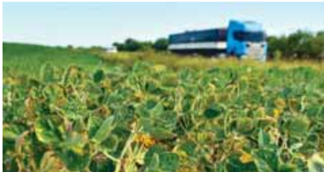
Maiores perdas aconteceram na produção de grãos, como a soja

● Com prejuízo de R$ 29,6 milhões, Santa Cruz decreta emergência. Levantamento da Emater aponta maiores perdas na produção de grãos. Hortaliças, pomares e pastagens também foram afetadas. Medida facilita ações de auxílio.