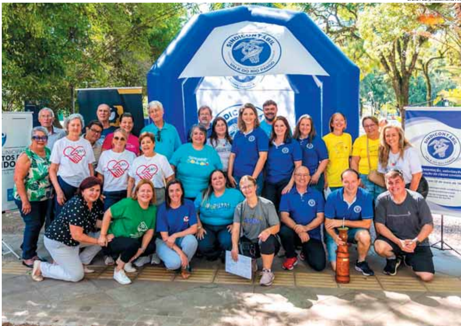
Campanha Ensinando a Destinar entra na quinta edição. Mobilização é essencial para ampliar doações do Imposto de Renda (IR) da Pessoa Física