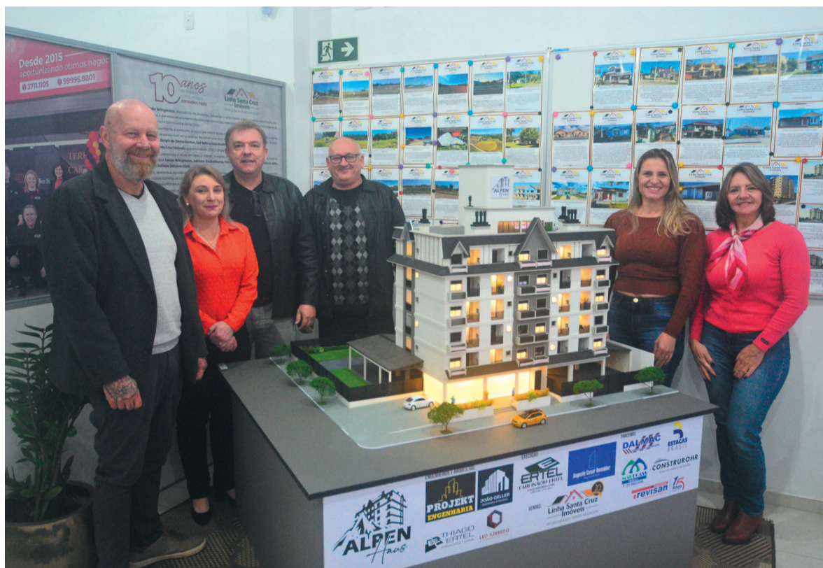
Representantes da Santa Cruz Imóveis, da Incorporadora Alpen e da construtora, com a maquete do Alpen Haus

Segundo Bringmann, embora a maioria das pessoas opte pela construção de casas, o Alpen é uma nova alternativa para quem deseja morar em Linha Santa Cruz. “A ideia, além do embelezamento do próprio prédio, é incentivar novas edificações nesse estilo para que a gente possa criar, quem sabe, uma cultura de fazer edificações diferenciadas.”