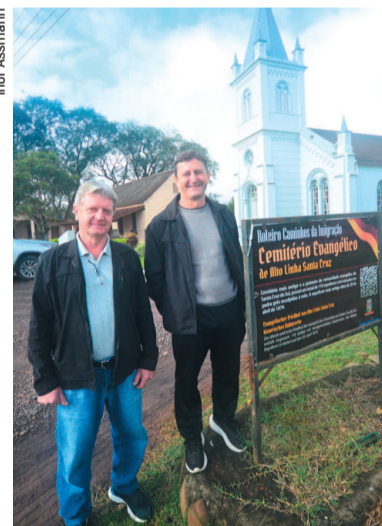
Kistenmacher e Harz, da Jealisc

Neste ano, a escola está ampliando e qualificando sua estrutura física e tem como meta a construção de alojamento para as estudantes meninas. Isso permitirá ampliar o número de jovens mulheres atendidas pela escola e fortalecer a luta histórica pela valorização da presença feminina na agricultura familiar, especialmente em espaços de gestão, liderança e orientação técnica no meio rural. Fundada em março de 2009, a Efasc é a primeira da região Sul do Brasil.