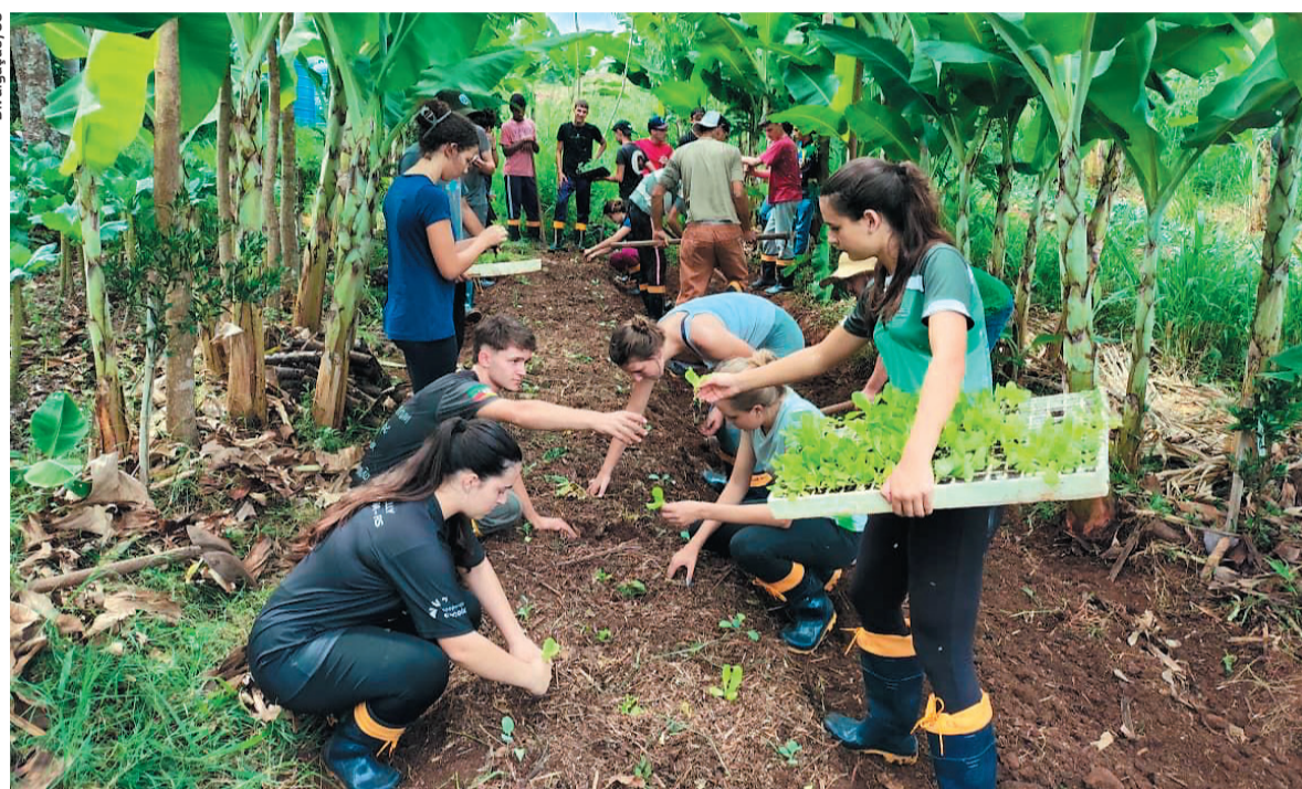
No decorrer do curso na Efasc, estudantes têm a oportunidade de vivenciar, na prática, ações vinculadas à agricultura