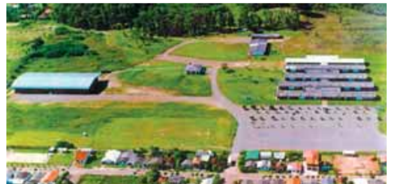
Os primeiros blocos já no atual endereço

Atendendo às propostas de parceria de alguns municípios gaúchos, a Universidade estabeleceu campi fora de sede em Sobradinho, em 1998; em Capão da Canoa, em 2001; em Venâncio Aires, em 2004; e em Montenegro, no ano de 2011. Hoje, mais de 30 anos depois, a Unisc segue desenvolvendo um papel importante em todas as regiões nas quais atua, reforçando o caráter de universidade comunitária.