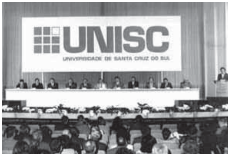
Em 11 de agosto de 1993, solenidade no Cine Vitória marca instalação oficial da universidade

Odontologia, e 51, para os da Engenharia de Produção. Em 2000 foi a vez dos blocos 18 e 34, para atender às necessidades dos cursos de Direito e de Fisioterapia, e