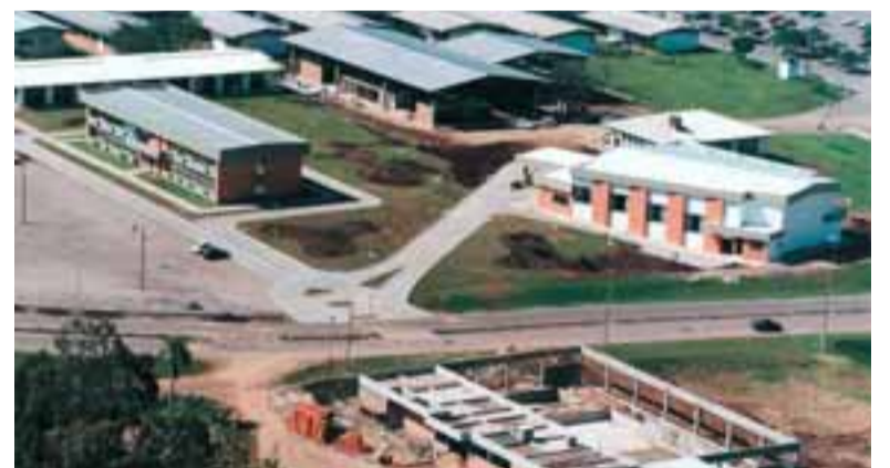
Ao longo dos anos, a construção de novos blocos para acompanhar a evolução da Unisc